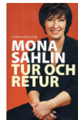
MONA SAHLIN TUR OCH RETUR Håkan A Bengtsson, Bokus 2008