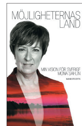
MÖJLIGHETERNAS LAND (Norstedts 2010)