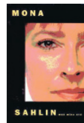
MED MINA ORD (Rabén Prisma 1996)