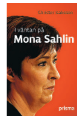
I VÄNTAN PÅ MONA SAHLIN Christer Isaksson, Prisma 2008