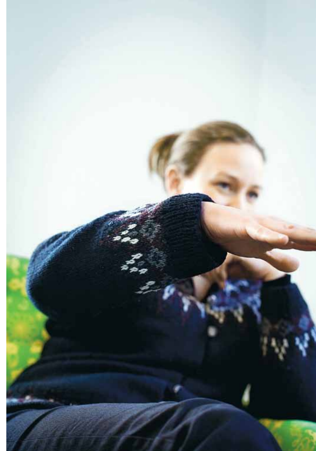
Det är närmast omöjligt att inte tycka om Maria Wetterstrand.

MARIA WETTERSTRAND HAR dock den där förmågan att låta klok och övertygande. Vi diskuterar apropå klassresemat i Neo nr 1 – 2010 om det är